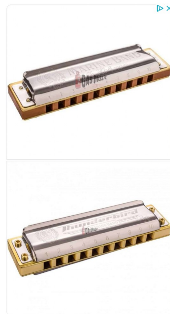
Strumenti usati garantiti Gas Music Store